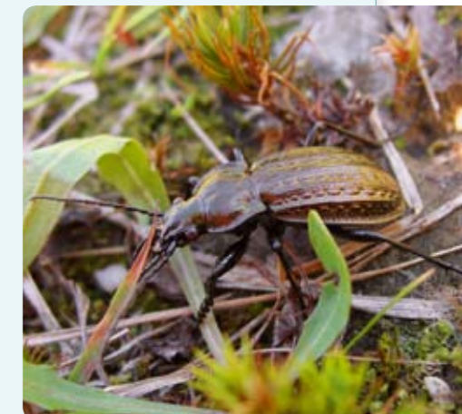
Glaciální relikv stěvlík Ménetriešův je typickým druhem rašelinišť.

Indikátorem lokalit s nenarušeným vodním režimem je vzácná ostřice dvoudomá.