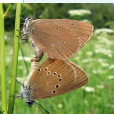
Modrásek bahenní se vyskytuje v nižších částech Boletic na vlhkých loukách s krvavcem totemem. Létá v červenci a srpnu.