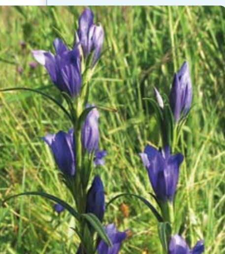
Hořec hořepník je typickým druhem bezkolencových luk.