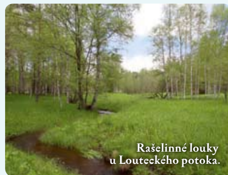
Rašelinné louky u Louteckého potoka.

Rašeliňště vznikají kolem pramenů nebo mělkých jezer ukládáním organické hmoty. Pokud je prostředí kyselé, hmotu tvoří především rašeliníky a vzniká tak rašelina. Pokud je k dispozici dostatek minerálních živin, organickou hmotu tvoří hlavně trávy a ostřice, čímž vzniká slatina. Vegetace na slatině a na rašelině se značně liší, velkou roli hraje i mocnost organického substrátu. Existuje však řada lokalit přechodného charakteru.