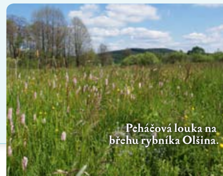
Pcháčová louka na břehu rybníka Olšina.

Pokud nejsou mokřadní louky dlouhodobě sečeny, přecházejí často v tzv. tužebníková lada. V nich je nejnápadnější vysoký tužebník jilmový, který jakoby přerostl většinu trav i ostatních bylin. Tužebníková lada bývá možné vhodným