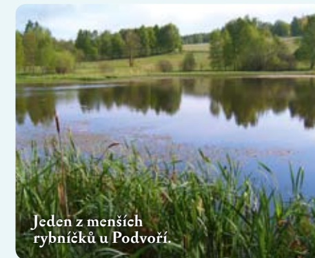
Jeden z menších rybníků u Podvoří.

Mokřadní porosty kolem rybníků a v hlubších terénních depresích představují druhově spíše jednotvárné porosty