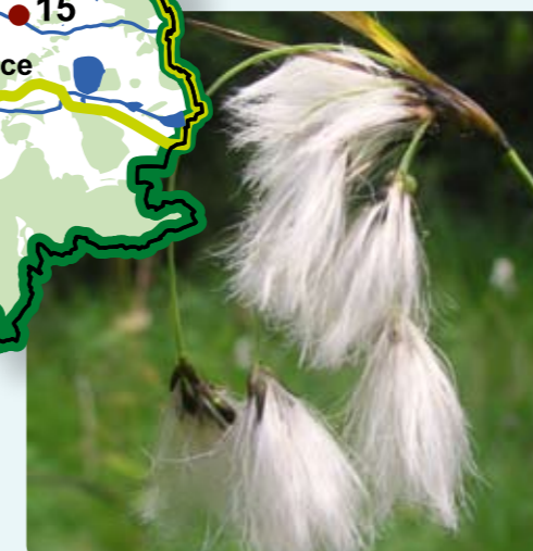
Suchopýr široolistý je vzácnou rostlinou mokřadních luk.