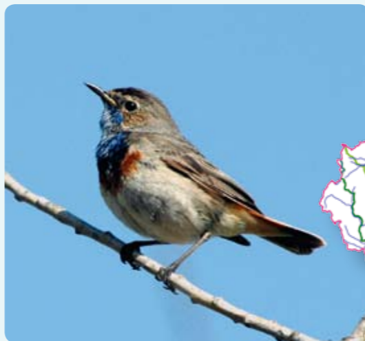
Slavíka modráčka je možno vzácně zahlédnout v rákosových porostech.