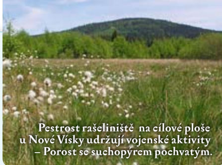
Pestrost rašeliníště na cílové ploše u Nové Vísky udržují vojenské aktivity – Porost se suchopýrem pochvatým.

Příroda vojenského újezdu byla v posledních desetiletích shodou historických okol-