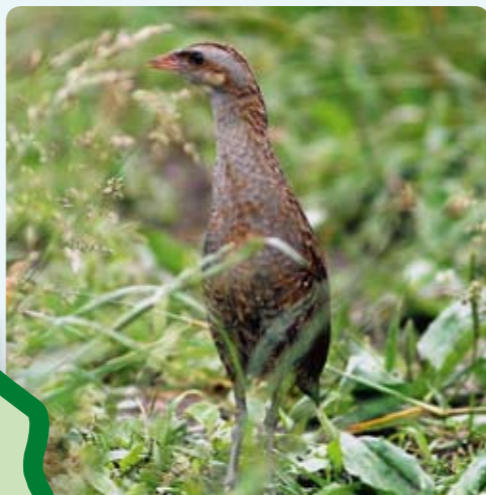
Chřástal polní se vyskytuje v počtu do 100 párů.